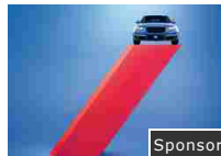
L'RCA che ti protegge anche dai Veicoli non Assicurati