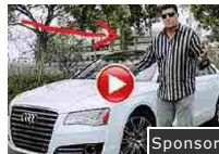
Svela il segreto per guadagnare 9500 € al mese in Borsa!