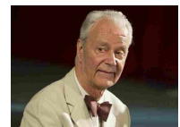
E' morto Paolo Poli, artista colto e libero - Toscana