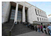
Sesso con minori, parroco sospeso - Lombardia