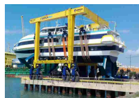
A Trapani aliscafo più grande al mondo - Sicilia