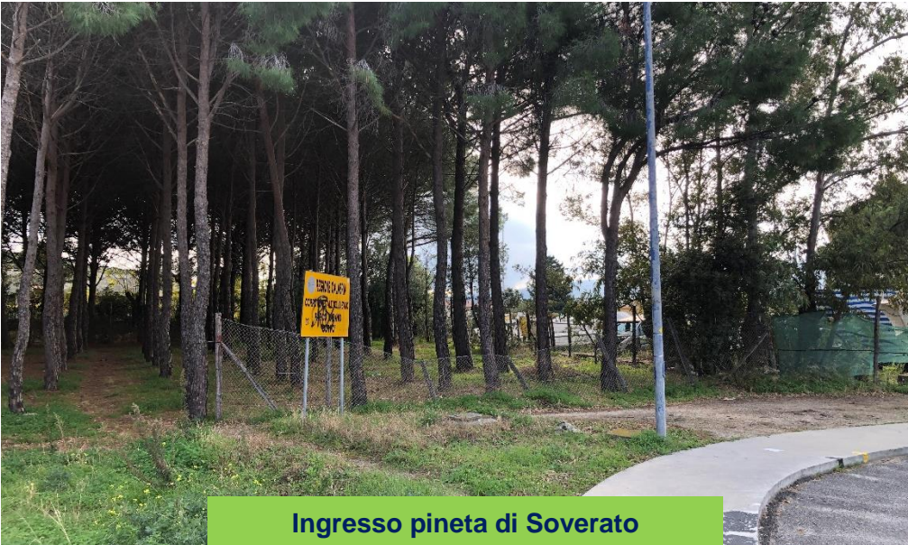
Ingresso pineta di Soverato