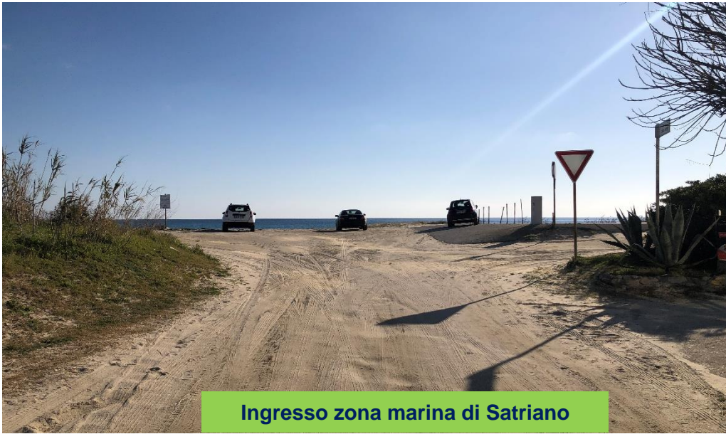
Ingresso zona marina di Satriano