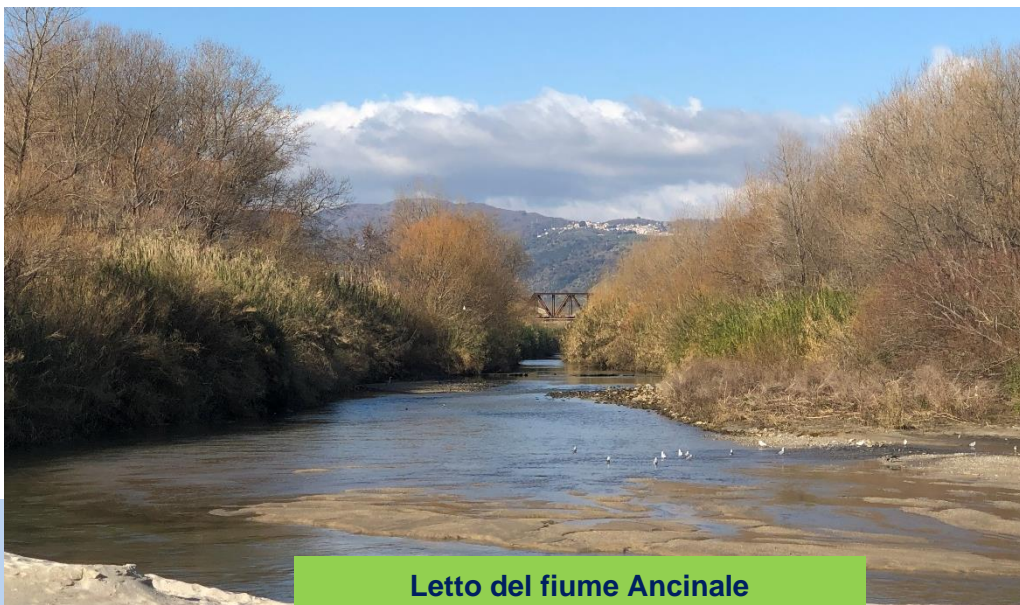
Letto del fiume Ancinale