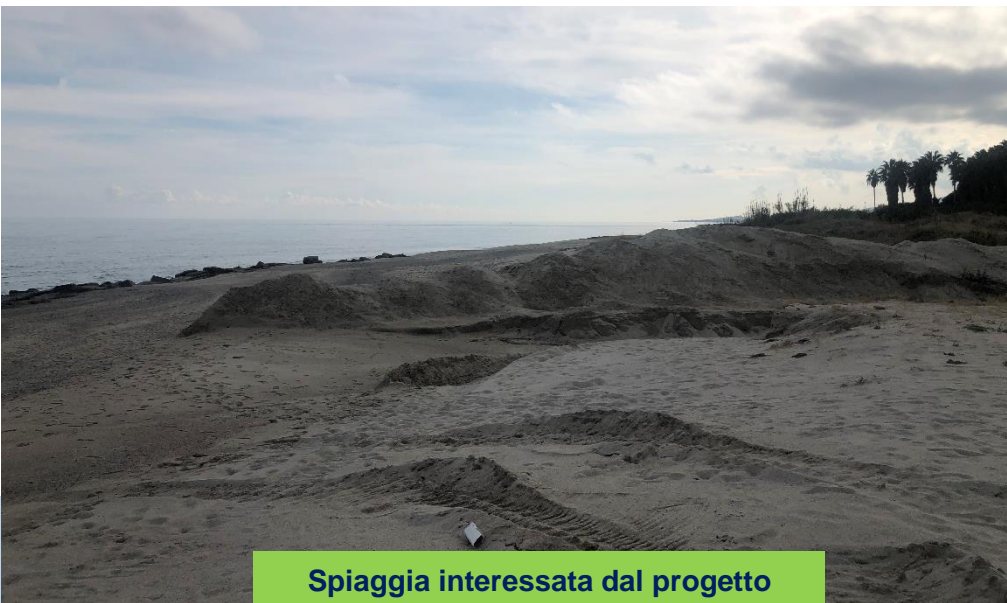
Spiaggia interessata dal progetto