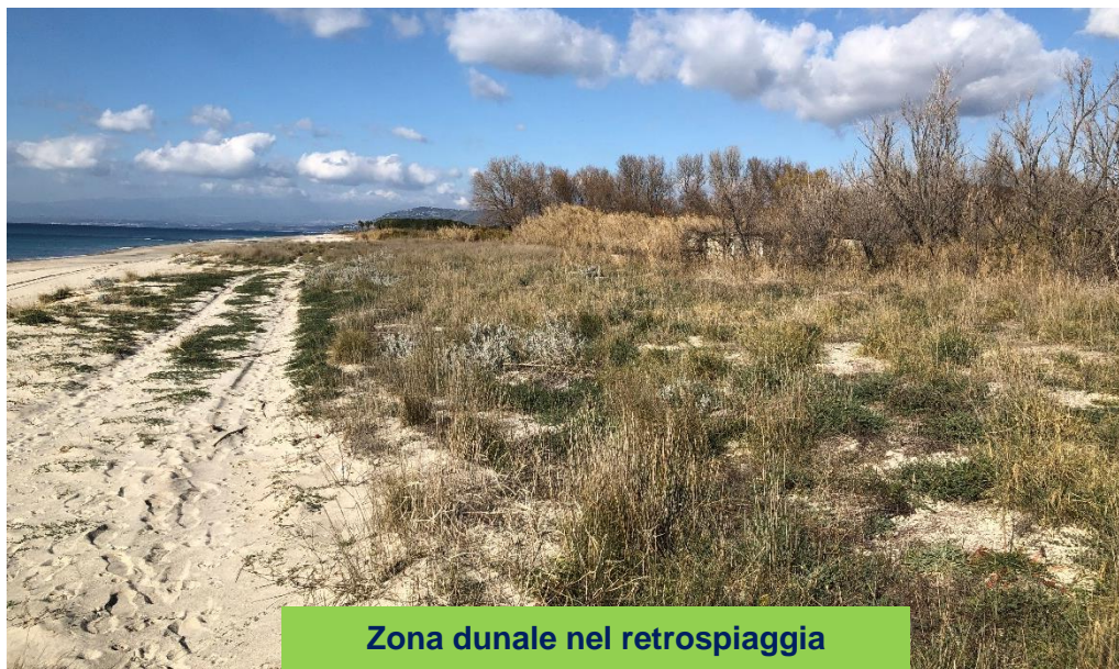
Zona dunale nel retrospiaggia