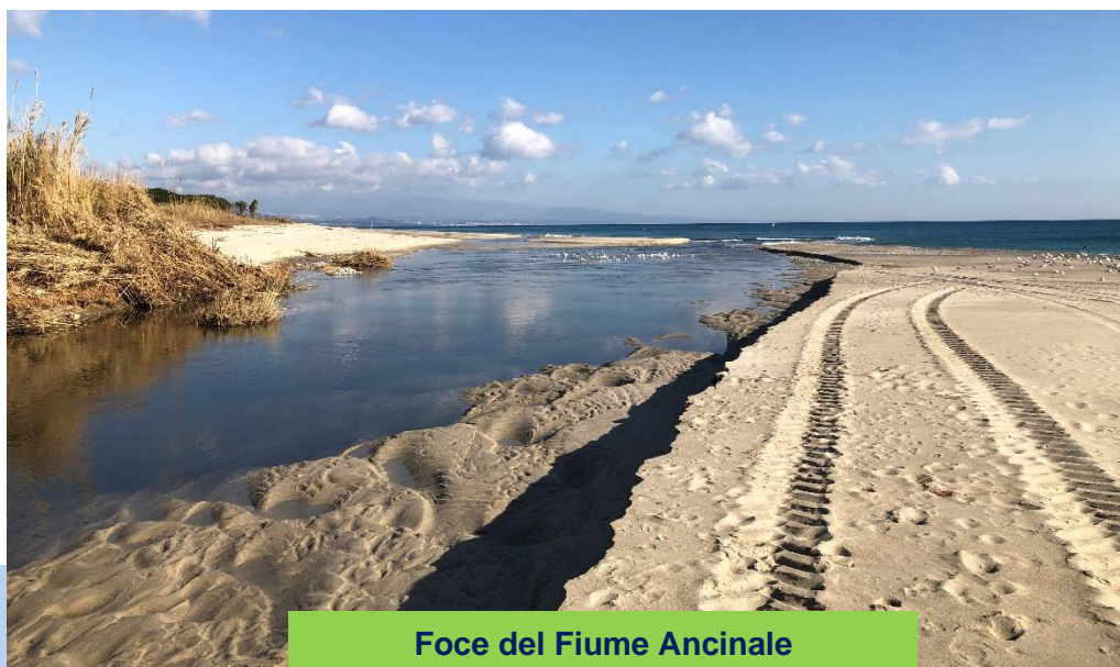
Foce del Fiume Ancinale