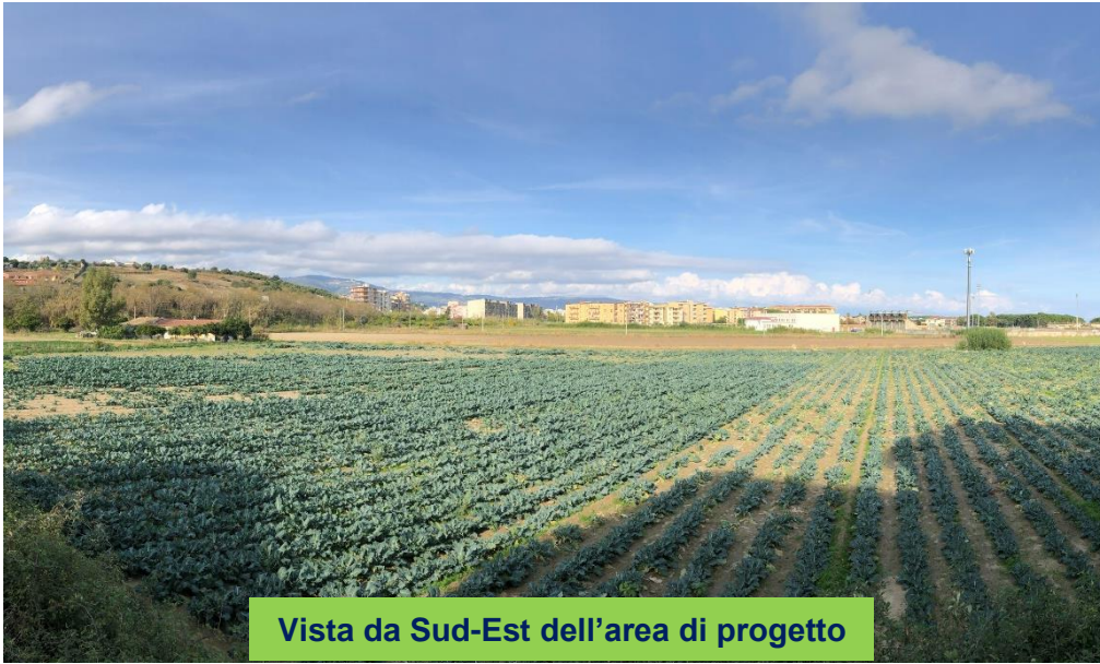
Vista da Sud-Est dell'area di progetto