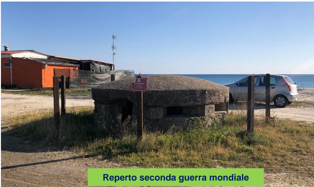
Reperto seconda guerra mondiale