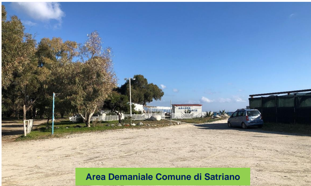
Area Demaniale Comune di Satriano