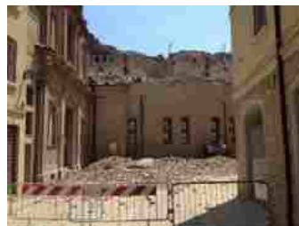
TERREMOTO IN EMILIA ROMAGNA JPEG

l'esecutivo presieduto da Mario Monti decise di aumentare le accise sui carburanti di 0,02 euro al litro. Stando ad una spesa per la ricostruzione che dovrebbe aggirarsi attorno ai 13,3 miliardi di euro nominali, il gettito riscosso fino adesso con l'accisa sulla benzina e sul gasolio per autotrazione è stato di quasi 2,7 miliardi di euro nominali. Con i dati attualizzati, sia i costi che il gettito sono in linea con i valori nominali.