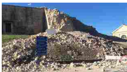
CASTELLUCCIO DI NORCIA

D'altra parte, il Consiglio Nazionale degli Ingegneri ha stimato "in 70,4 miliardi di euro nominali (121,6 miliardi, se attualizzati) il costo complessivo reso necessario per ricostruire tutte e sette le aree fortemente danneggiate dal terremoto (Valle del Belice, Friuli, Irpinia, Marche/Umbria, Molise/Puglia, Abruzzo ed Emilia Romagna)". Ecco allora che i conti non tornano: notano da Mestre "che in quasi 50 anni in entrambi i casi (sia in termini nominali sia con valori attualizzati)