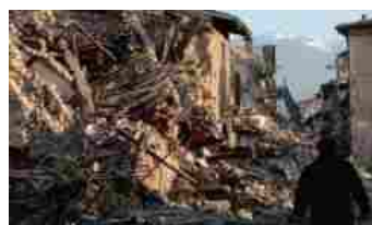
2009-TERREMOTO IN ABRUZZO

Abruzzo (2009): il Governo di Silvio Berlusconi ritoccò il prezzo della benzina e del gasolio per autotrazione di 0,004 euro al litro. A fronte di una spesa ipotizzata di 13,7 miliardi di euro nominali, lo Stato finora ha incassato 539 milioni di euro nominali. Attualizzando i dati, invece, il costo è sempre di 13,7 miliardi di euro e il gettito proveniente dall'accisa di 540 milioni di euro;