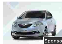
tua da 9.750€, anticipo 0, TAN 0, TAEG 4,33% Sponsor