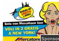
Solo con Mercatone Uno puoi volare gratis in 2 a New York. Sponsor