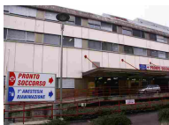
Bimba di 10 mesi precipita dal balcone - Cronaca