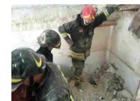
Scoppia bombola gas, un morto e feriti - Cronaca