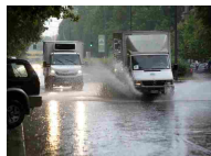
Maltempo: Protezione civile, precipitazioni su tutta penisola - Cronaca