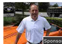
Come sono diventati milionario con 25000€ di entrate l'anno! Sponsor