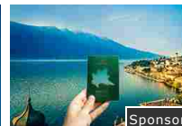
Ritirato e colleziona le tue esperienze in Lombardia Sponsor