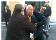
Attivisti Forconi aggriscono Osvaldo Napoli, "delinquenti" VIDEO - Politica