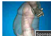
Esiste un metodo che può aiutare a perdere kg di troppo! Sponsor