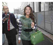
Berlusconi, il Senato non autorizza l'uso di intercettazioni. Scontro e scambio di...