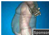
Sponsor Esiste un metodo che può aiutare a perdere kg di troppo!