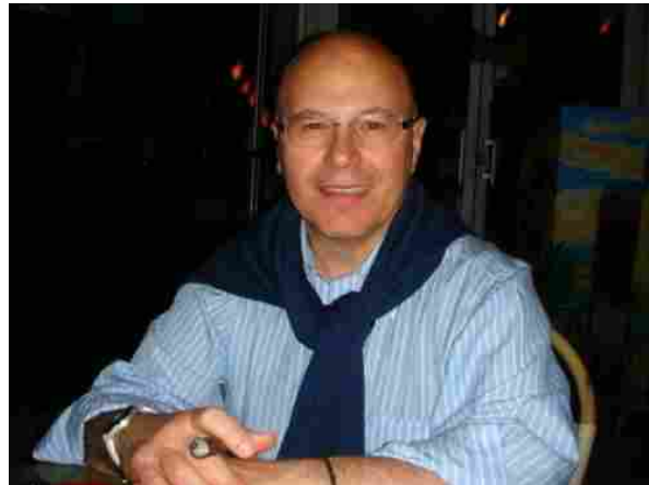
Giovedì 05 Ottobre 2017 - 19:26