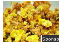
Esiste un metodo che può aiutare a perdere fino a 18 kg! Sponsor