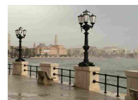
Cadavere di donna trovato in mare a Bari - Cronaca