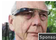
Questo basta per parlare l'inglese come un madrelingua. Sponsor