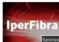
IperFibra Vodafone da 25€ e Netflix incluso per 3 mesi Sponsor