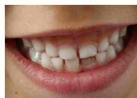
I denti si riparano da soli, con le cellule staminali - Biotech - Scienza&Tecnica