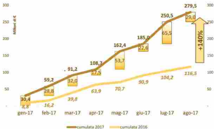
IMPORTI A BASE D'ASTA DELLE GARE PER I SERVIZI DI INGEGNERIA E ARCHITETTURA (SENZA ESECUZIONE) GENNAIO-AGOSTO 2017 E CONFRONTO CON STESSO PERIODO DEL 2017 (VAL. IN MILIONI DI EURO)

E' opportuno evidenziare che il mercato, già in sensibile crescita dall'inizio dell'anno, ha proseguito la fase espansiva anche dopo l'entrata in vigore del Decreto Correttivo al Codice dei Contratti Pubblici (D.Lgs 19/04/2017 n° 56) approvato dal Consiglio dei Ministri il 19 aprile ed entrato in vigore il 20