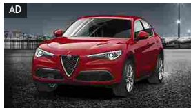
ALFA ROMEO STELVIO

A luglio su Giulietta tutti gli optional sono in omaggio sulle vetture in pronta consegna