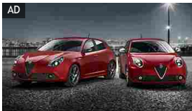
ALFA ROMEO GIULIETTA