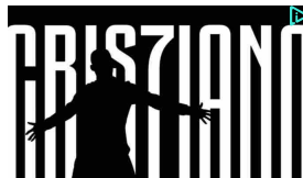
CR7 a Torino, niente ...