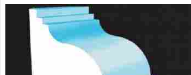
Matrici in polistirene espanso