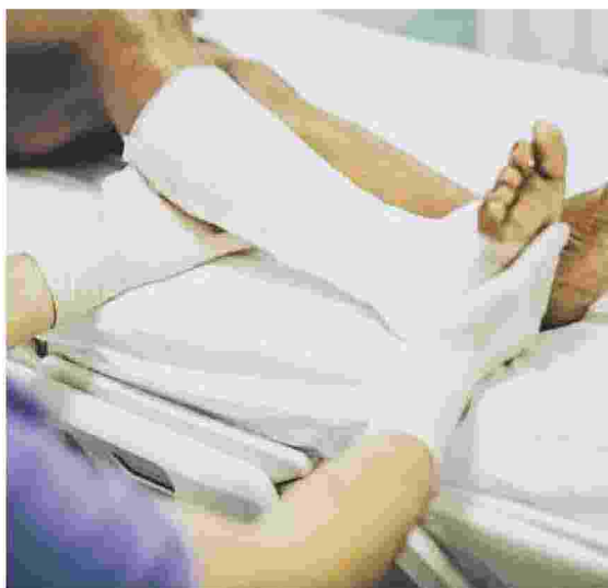
NEL 2018 CI SONO STATE 645MILA DENUNCE DI INFORTUNI

Il coordinatore della progettazione ha il compito di verificare i criteri di sicurezza