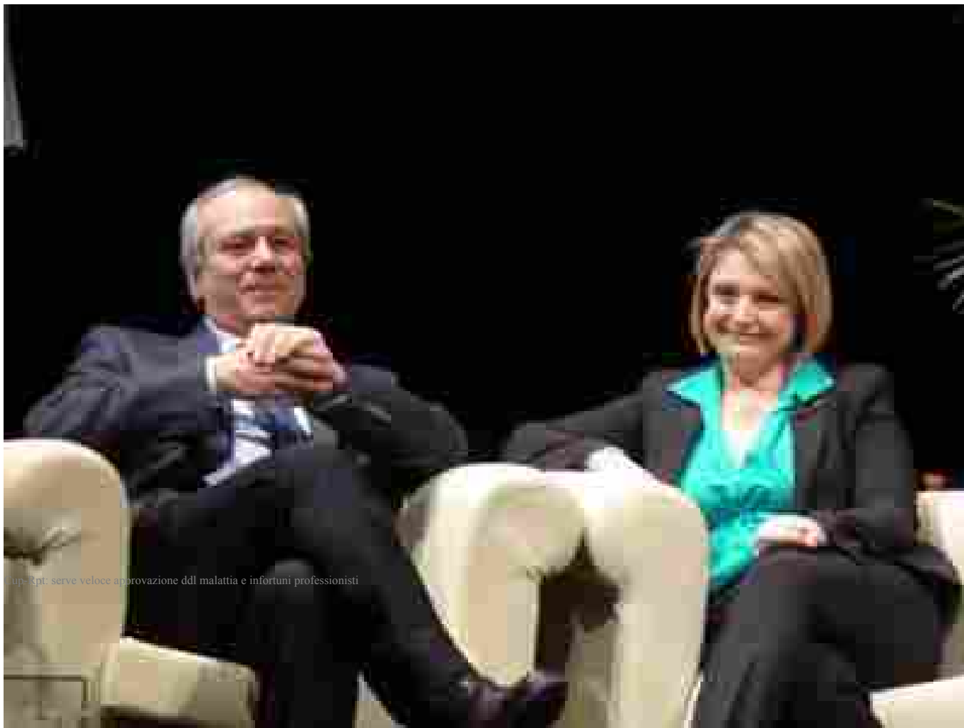
Cup-Rpt: serve veloce approvazione ddl malattia e infortuni professionisti

Calderone-Zambrano, con migliaia professionisti vittime Covid-19 serve iter veloce