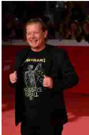
GIANNI LEMMETTI ASSESSORE AL BILANCIO DEL COMUNE DI ROMA