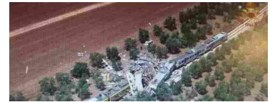
Puglia, strage di viaggiatori