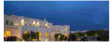
Fasano: Borgo Egnazia, miglior hotel del