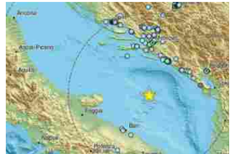
Il sisma Tremore la terra in Puglia e Basilicata: terremoto nell'Adriatico meridionale, magnitudo 4.7