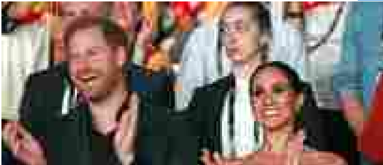
Harry e Meghan annunciano due nuove serie Netflix