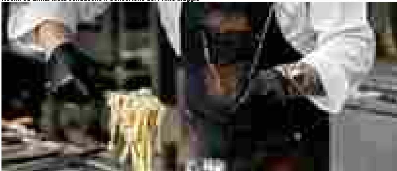
Pasta fresca italiana doc, è trend a Londra

Ritaglio stampa ad uso esclusivo del destinatario, non riproducibile.