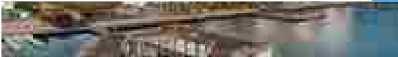
Trekanten, viaggio nel cuore dello Jutland danese