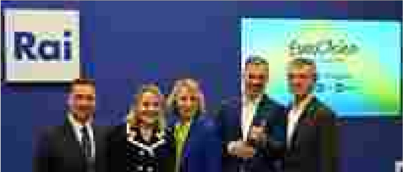
Corsi e Maionchi, 'all'Eurovision pronti a vestirci da Abba'