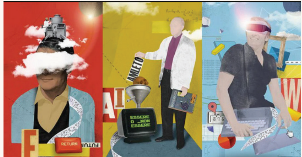
▲ Illustrazione di Nazario Graziano

Non bastava il gap tra domanda e offerta di competenze che da anni affligge il mondo del lavoro italiano (la percentuale di skill